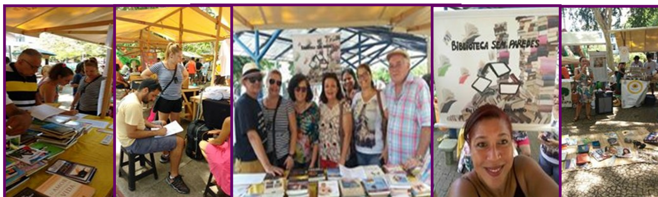
Biblioteca Sem Paredes