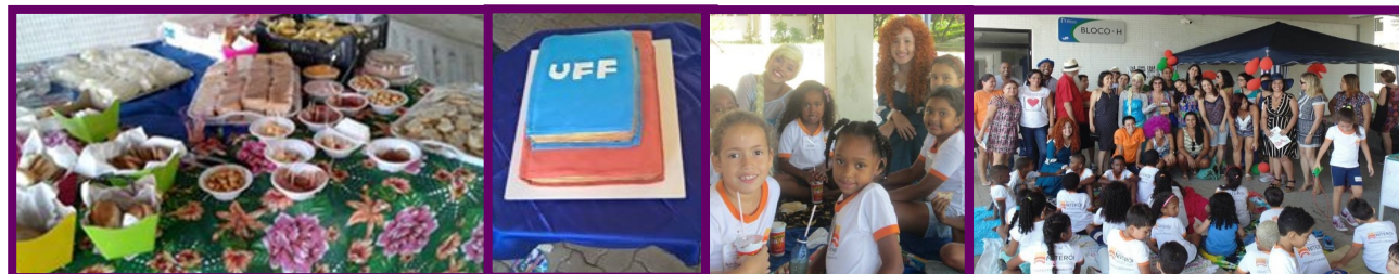
Biblionic na UFF