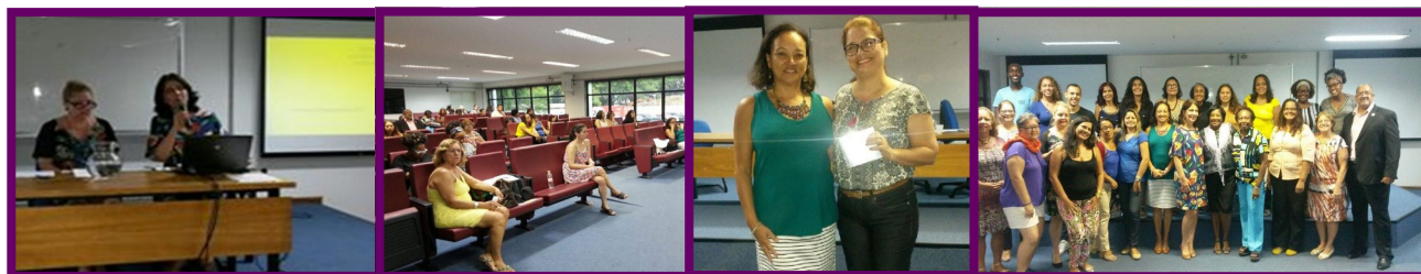
Palestras na UniRio